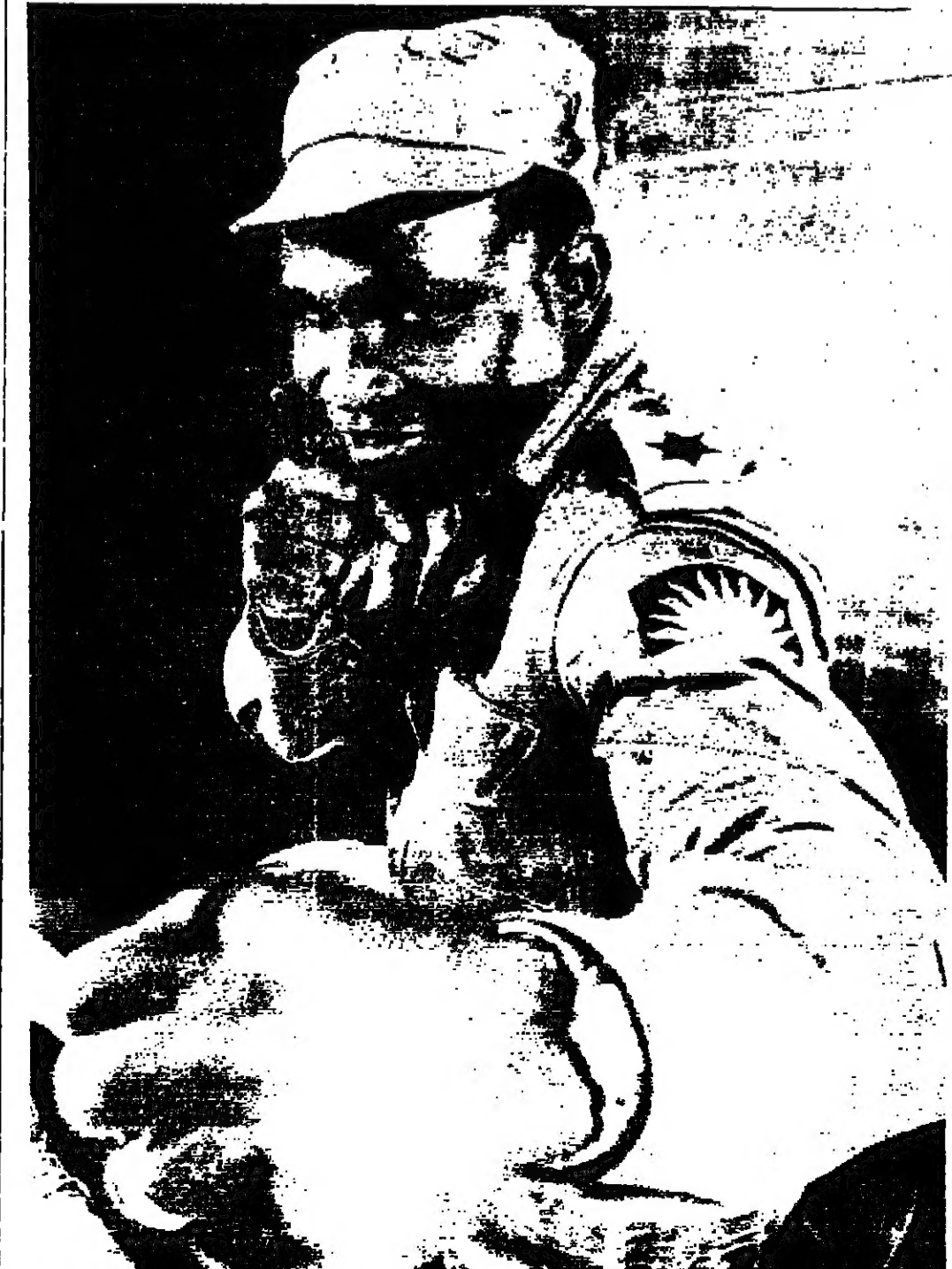
ديك تاغر بلل العالم في المكسة ( الموزن المتوسط شف امام المصورين وهو يرتدي بزته في جيش ( يانفار ) الجيش من اتحاد نيجريا . بقى ان تعرف ولد في اتكلم الشرق للاستاذ الدكتور ( مسرة اليريفانير )

أري المستور - بقية ان كل ضربة توجهها ستلقى مقابلها ضربتين . ومن هنا يصبح واجب العرب على جميع جهات وقف اطلاق النار ان يكونوا على درجة من الاستعداد العسكري تتيج لهم الرد بنفسك وقسوة على التحرشات الإسرائيلية . وإذا كانت إسرائيل قد أصبحت تجد في مخيمات الفارين أو في سكان مدن القناة هدفا سولا لاغناءاتها ، فإن من الخطأ أن تؤخذ هذه البديهة بعين الاعتبار فاما ان ينقل السكان الأفريقيين بعيدا عن مرمى تران اندنو ، أو «التكيف» هذه المناطق مع احتمالات العدوان ، فتشفي فيها الضحايا وبوسائل الوقاية المختلفة الموجودة في مستعمرات الحدود الإسرائيلية . ان هدف إسرائيل من ضرب المدنيين واضح وهو نشر حالة من الذعر والخوف في أوساطهم تصور انها ستكون سلاحا في يدها لترضي الحادول التي تريدتها الأتمة . وليس مما يفيدنا إلا اليأس على الموتى ، ولن ينفعنا كذلك ان نستصرخ شعوب الدنيا ونقول لها : تعالي فشاهدي ما يفعل (الشعب الله الخائر) . ان القوة المتفطرة العبياء الجموح التي تلبس إسرائيل ان يرددها سنوي قوة تماثلها في الشدة وقوة الردع . وياهم العرب طريق طويل مفروشة بالدماء واتسلاء الضحايا ، مكتوب عليهم . بحكم القدر والقاريخ ومنطق الطبيعة - ان تقطعوا قبل ان يقصوا على هذه الجرثومة السرطانية التي استشرت في وطنهم .